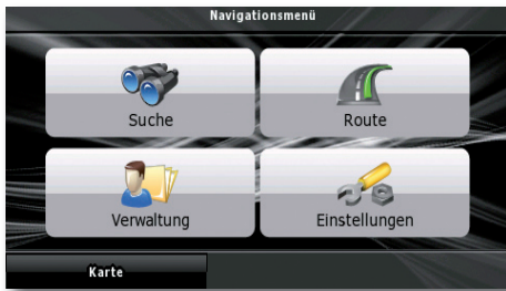
Die Bedienung der Navigation über den großen Touchscreen ist selbsterklärend