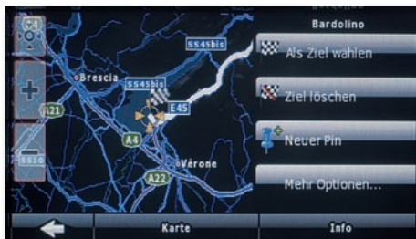
Auch die Nachtansicht ist grafisch sehr ansprechend

rungsanzeige, Kreuzungszoom und eine extrem umfangreiche Sonderziel-Datenbank seien nur als Beispiele genannt. Die Kartenansicht kann auf 2- oder 3-D eingestellt werden, bei der Routenberechnung stehen die schnellste,