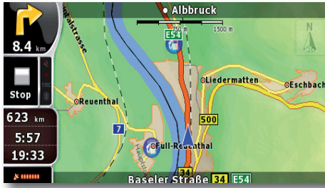
Die Karte ist in allen Ansichten klar und übersichtlich