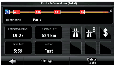
Auf einen Fingertipp können diverse Routeninformationen angezeigt werden