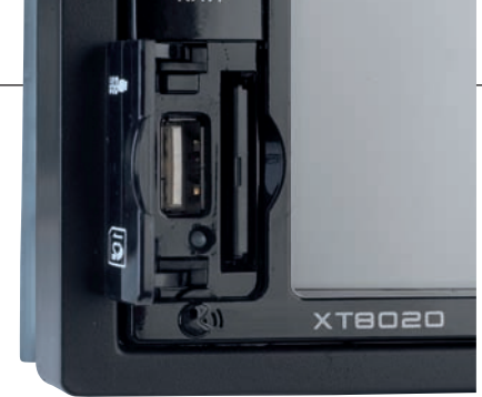
USB- und SD-Slot sind hinter der Klappe vor Schmutz geschützt