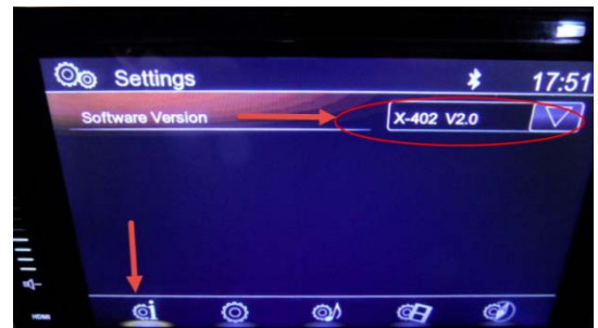
Abbildung 1: Anzeige der Versionsansicht bei allen neueren XZENT Modellen mit kapazitivem Touchscreen