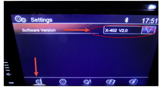
Abbildung 1: Anzeige der Versionsansicht bei allen neueren XZENT Modellen mit kapazitivem Touchscreen

Antw.: Es wird für alle Benutzer empfohlen, die die v1.0 installiert haben (Betrifft alle Geräte die vor dem 01.12.2017 an Händler geliefert wurde)